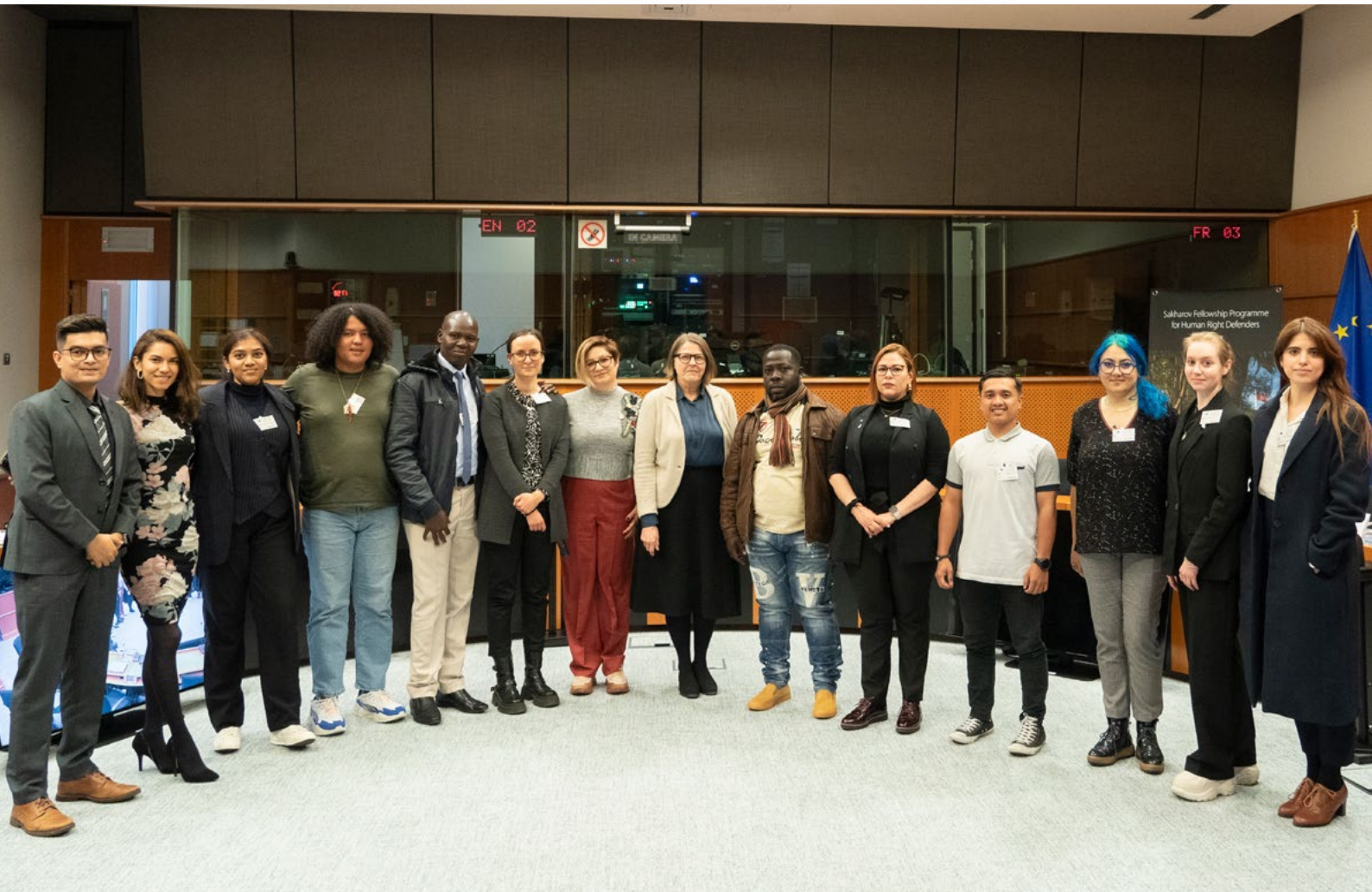
► BOURSIERS SAKHAROV 2024 AVEC HEIDI HAUTALA, VICE-PRÉSIDENTE

Grâce au programme «Triangle pour la démocratie» , les députés aident les parlements partenaires à rassembler des législateurs, des représentants de la société civile et des professionnels des médias afin de lutter contre la désinformation tout en protégeant la liberté d'expression.