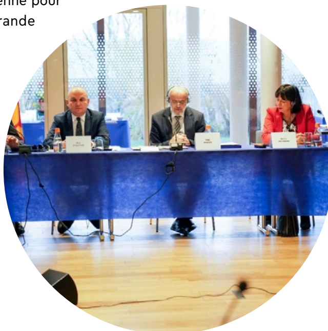
► DIALOGUE JEAN MONNET AVEC LE PARLEMENT DE MACÉDOINE DU NORD

Des députés au Parlement européen sont intervenus en tant que médiateurs en Ukraine, en Serbie et en Macédoine du Nord, ce qui a apporté de la valeur ajoutée aux mesures globales prises par l'Union européenne pour résoudre les conflits tout en conférant une grande visibilité au Parlement européen.